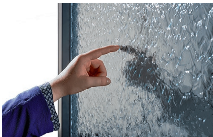
Wasserelemente im Büro sind Eyecatcher und optimieren das Raumklima.